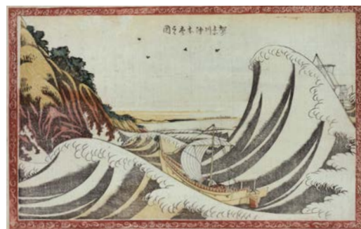
Honmoku au large de Kanagawa, vers 1804-1807.

Sur l'importance du mont Fuji au Japon : http://www.nippon.com/fr/currents/d00021/