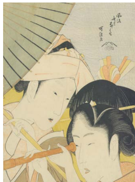
Longue vue. Format ôban 36,5 x 25,4 cm.

http://www.herodote.net/22_juin_1636-evenement-16360622.php