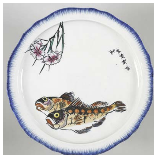
Assiette du service Rousseau.

Les thèmes illustrés sont : poissons et crustacés pour les parties du service destinées aux produits de la mer, volaille pour les pièces