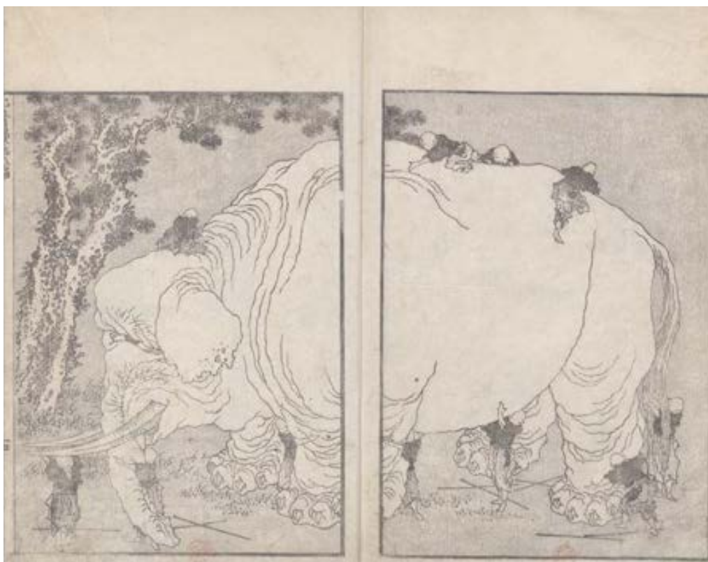
Carnet 8, folio 13, Aveugle décrivant un éléphant . Inconnu au Japon, l'éléphant est représenté selon les critères transmis par l'iconographie bouddhique : taille sans proportion avec la réalité, corps très plissé, oreilles semblables à des feuilles tombantes, expression souriante.