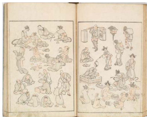
Carnet 1, folio 13.

Aujourd'hui, l'éditeur Unsôdô de Kyôto qui possède une collection de planches originales, exécute des retirages, à partir des bois gravés à la fin du 19 e s.