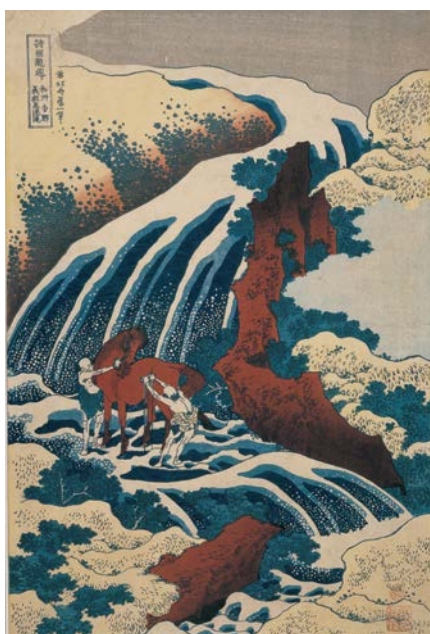
Cascade où Yoashimune baigna son destrier à Yoshino dans la province de Washû, 1833.