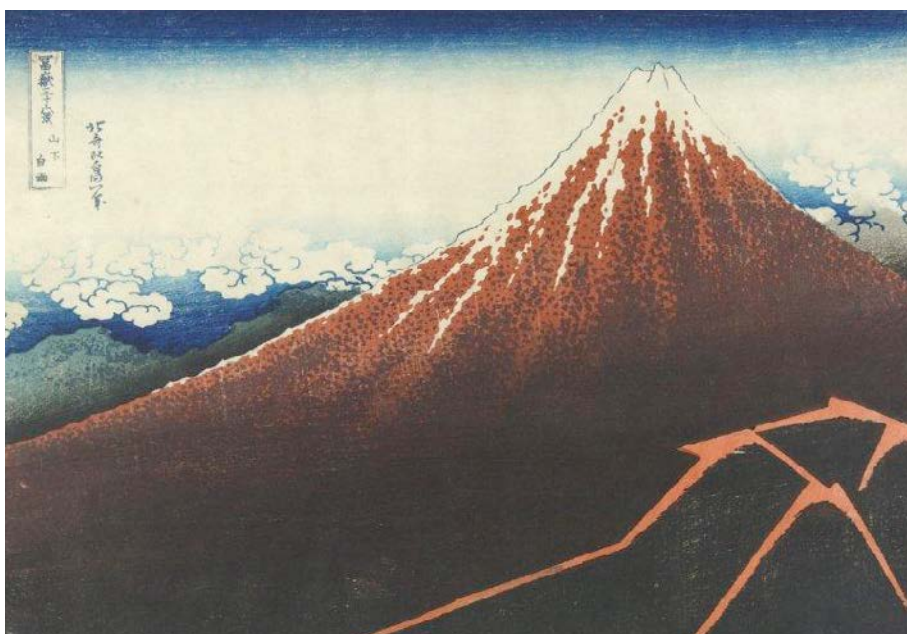
Orage en bas du sommet, vers 1830-1834.