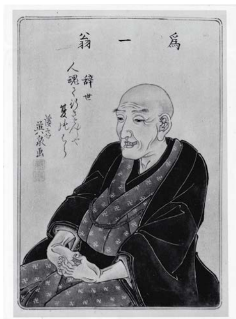
Portrait présumé d'Hokusai, Japon, localisation inconnue.

Hokusai, postface des Cent vues du mont Fuji in Louis Gonse L'art japonais vol 1, ch. IX p. 286